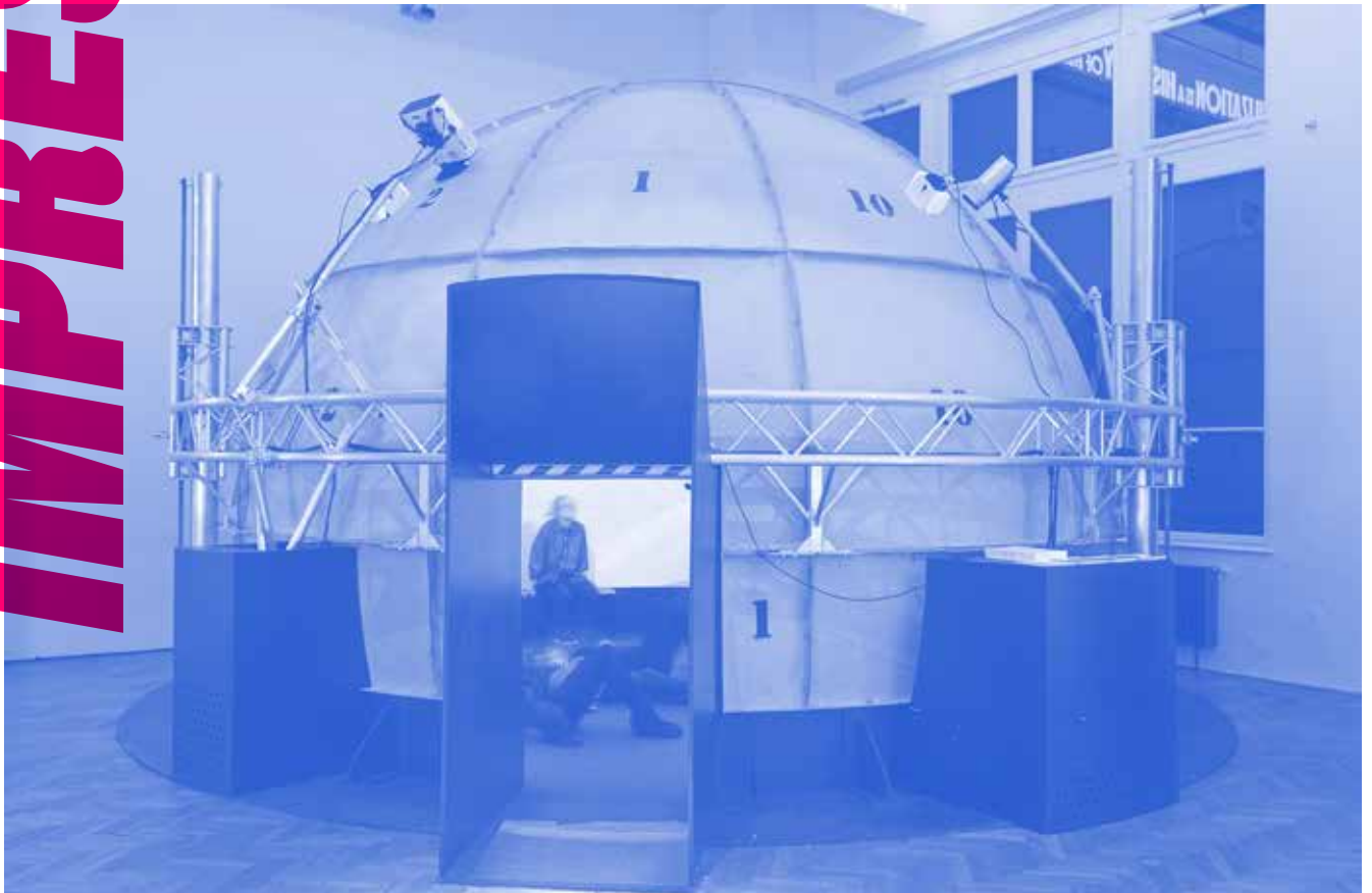
Fulldome Ausstellungsansicht MAK 2017

© 2021 Herausgeber – Alle Rechte vorbehalten