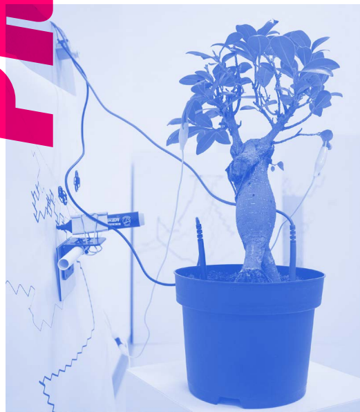
Erika Glionna Duet , 2019 Bioreaktive Installation

Kontakt für technischen Support und allgemeine Anfragen: digitalekunst@uni-ak.ac.at +43 171133-2640 (Office DIGITALE KUNST)